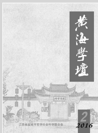
(封面图为水街一角)