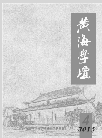
(封面图为盐城泰山庙)